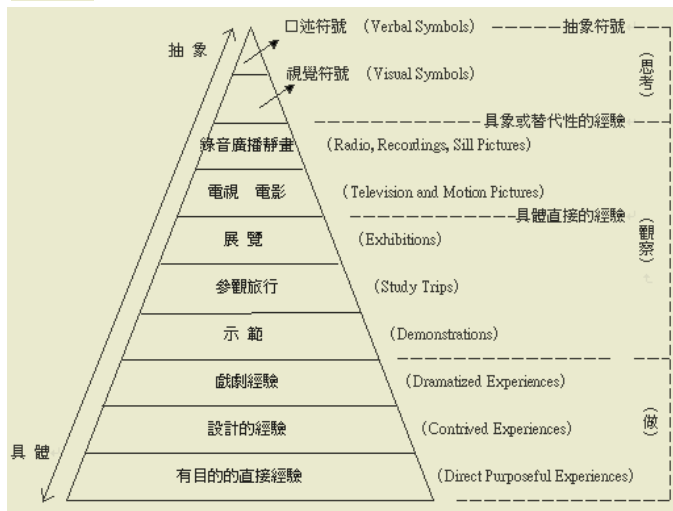
圖 5-2 經驗金字塔理論內容

知識是自個人直接（親身活動）或間接（透過文字、語言、圖片等媒體）的經驗中獲得。經驗緊密關連著人類的感官作用，其中以視覺及聽覺為重。塔上的層次非不變、嚴格的分界經驗的概述與歸納(4)戴爾的經驗金字塔與視聽教育的關係：教學中具有自「直接至間接」、自「抽象至具象」的各種不同經驗，而達到加強學習效果的目的。經驗金字塔表示各不同視聽教學媒體在教學上的相互關係，及在學習過程中的個別地位差異。