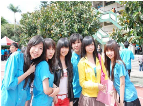
與友校班聯會合影