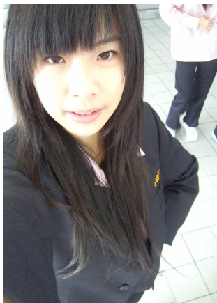
畢業了，展翅高飛吧！