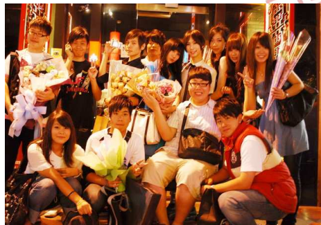
2009 年 社團成果發表會

人生不一定事事順心，但是凡事盡力，就對得起自己！我相信比賽亦是如此。所有的事情都讓我深深的體會到團隊合作與人際溝通的重要性，不影響自己課業為前提，家人非常的同意我參加各項活動，也都很支持我所做的決定。