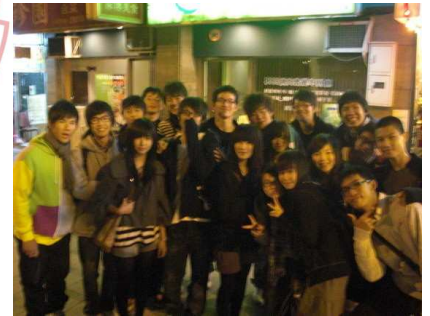
我的十九歲生日慶生會