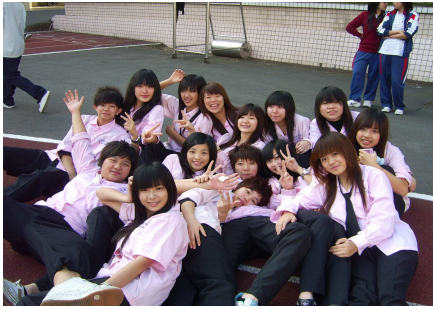
和班上好朋友們合影