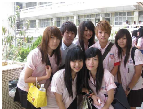
2009 年畢業典禮 學弟妹合影