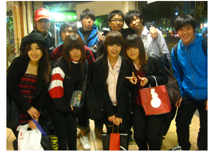
基商班聯會開會結束合影