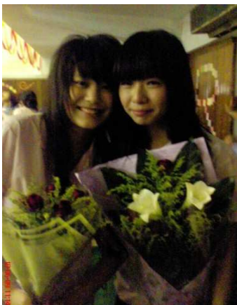
畢業典禮學妹獻花