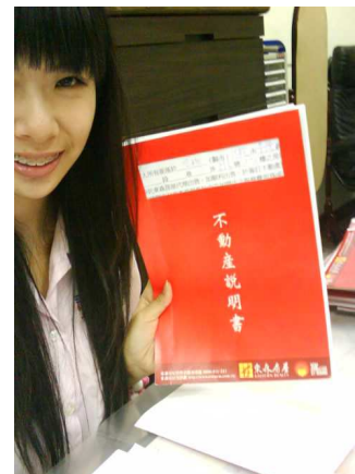
東森房屋行政助理