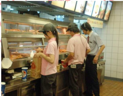
人生中的第一次打工