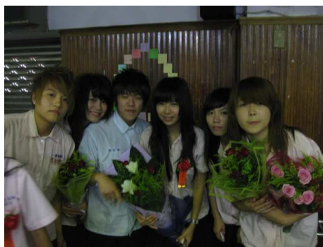
活動主持人後台合影