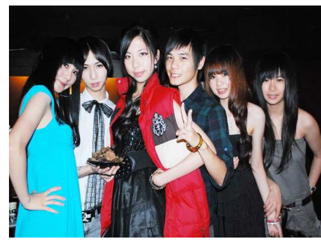
基商基中班聯會慶功宴