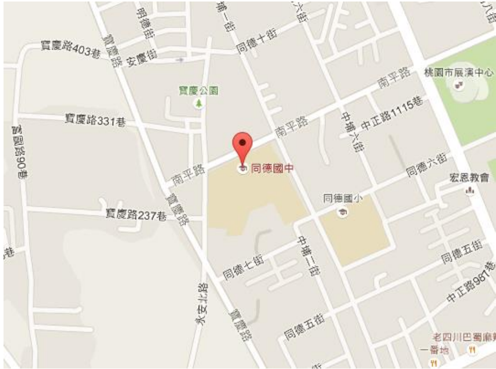
【桃園市同德國中位置圖】